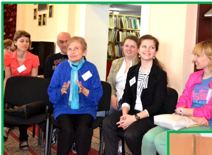
Діалог з читаючими родинами ОДБ ім. А.П.Гайдара