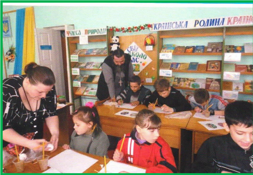
Заняття у дитячому інформаційному центрі православ'я «Віра і Надія» Олександрівська районна бібліотека для дітей