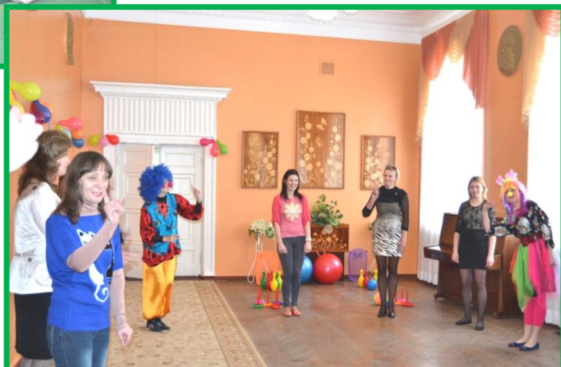
Захід бібліотечного атракціону «Усмішка» бібліотекарів-аніматорів відділу естетичного спрямування та організації змістовного дозвілля користувачів ОДБ ім. А.П.Гайдара