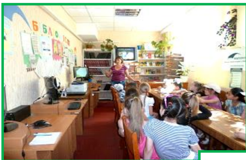
Комп'ютерні заняття дитяча бібліотека – філія № 8 Світловодська міська централізована бібліотечна система