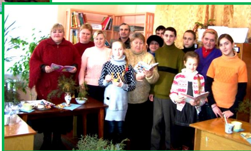
Сімейний клуб «Затишок» Добровеличківська районна бібліотека для дітей