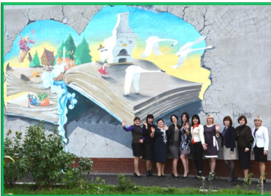
Малюнок у форматі 3-D «Тут живуть казкові герої» на фасаді ЦДБ ім. Ю.О.Гагаріна Олександрійської міської централізованої бібліотечної системи